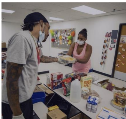
График работы пункта раздачи питания: С понедельника по пятницу, 12:00 – 14:00, в здании Academy360. Двери открыты для всех.

Обращайтесь к: Lakeshia@struggleoflovefoundation.org